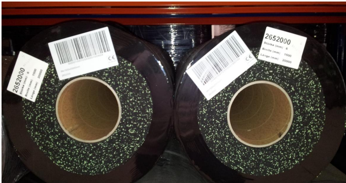
Figura 3: Durante la colocación observar especialmente el lote (ver etiquetas)