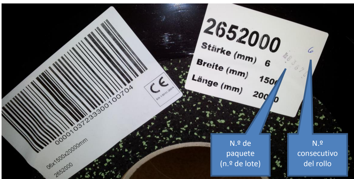
Figura 4: Rotulación de los rollos con el número de paquete y de rollo

Presente de inmediato su reclamación y detenga enseguida la instalación en caso de recibir producto erróneo o defectuoso, que la cantidad incorrecta o detecte otros posibles fallos. Solo es posible realizar la reclamación de materiales suministrados si estos no se han modificado y se indica el lote de producción (véase figura 4).